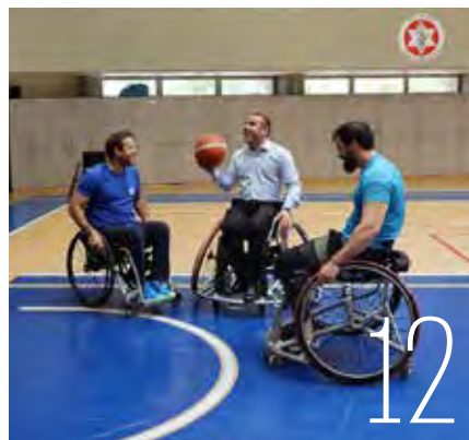
טקס חלוקת מלגות ספורט