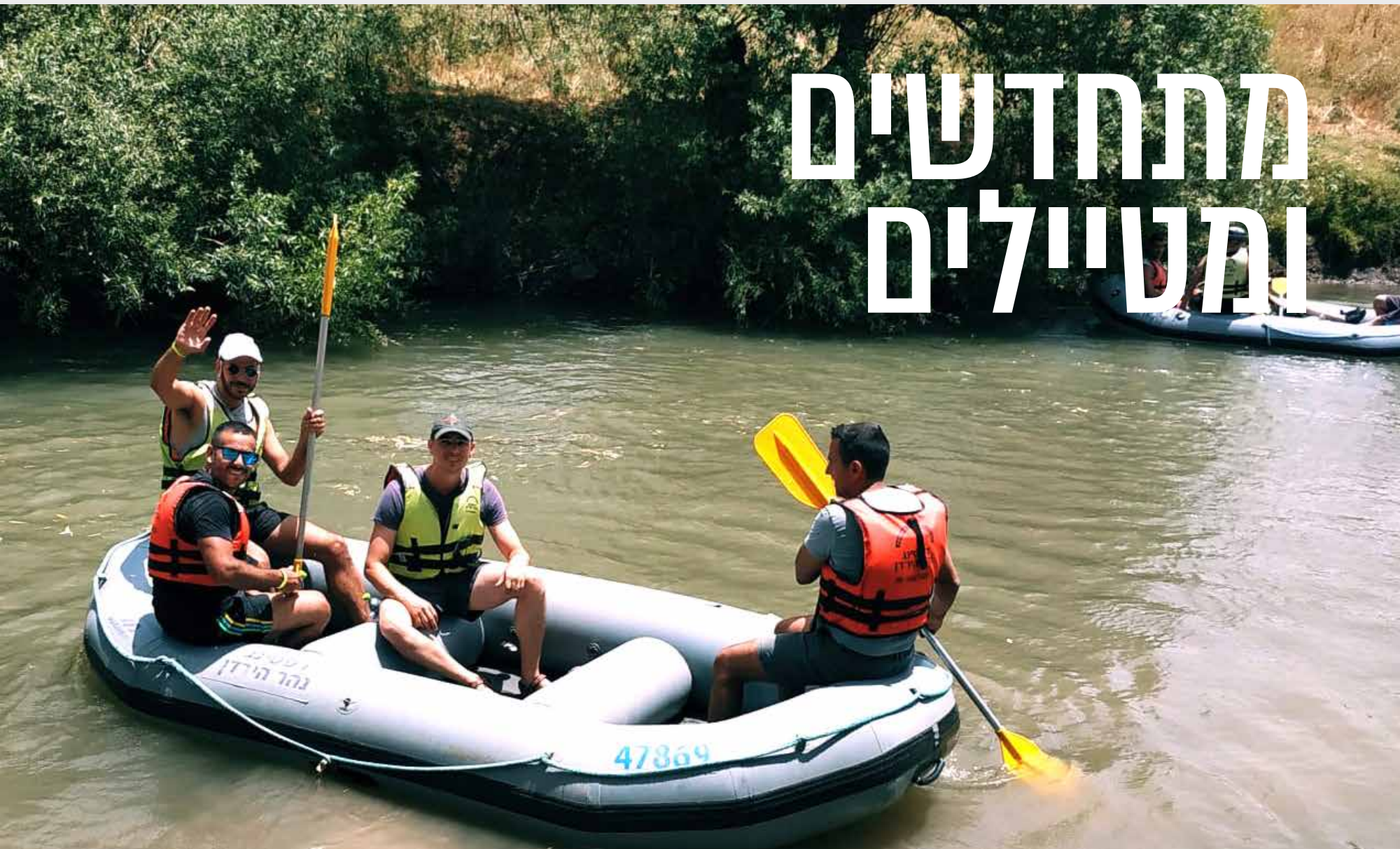
צעירי הבית בטיוול טרקטורונים ורפטינג בנהר הירדן

בחודשים האחרונים הבית מתחדש ומשנה פניו. לאחרונה נערכו שיפוצים בלובי הבית, באולם הטניס ובקומת ההנהלה, ולכבוד הקיץ פתחנו את הבריכה החיצונית. חברי הבית יוצאים לתחרויות וזוכים להישגים מרשימים וקבוצת הצעירים יוצאת לטיולים ושלל פעילויות. באמצע יוני ביקרה בבית הלוחם ובמשרדי מחוז חיפה והצפון ראשת עיריית חיפה, עינת רותם קליש.