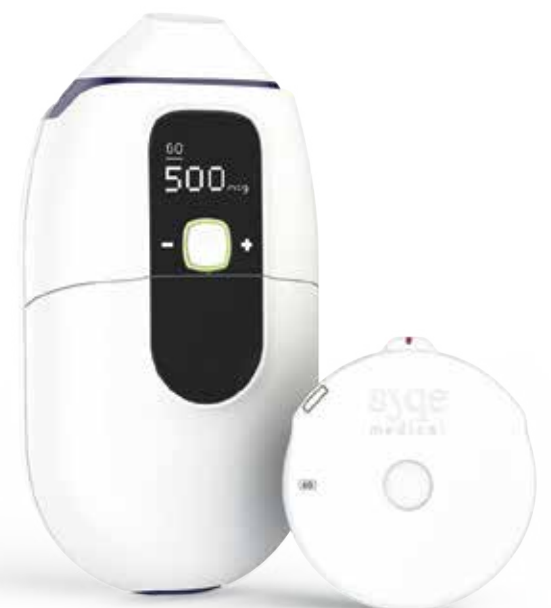
משאף ומחסנית Syqe

גיא אגמון, בן 48, קטוע רגל, נפצע באימון במסגרת שירותו הצבאי כלוחם בשנת 1991.