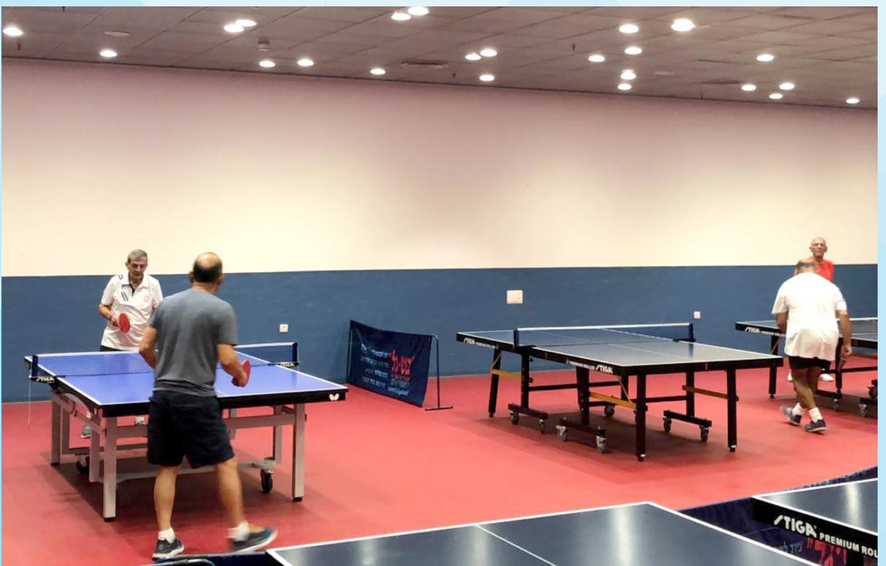
טניס שולחן בבית הלוחם ירושלים