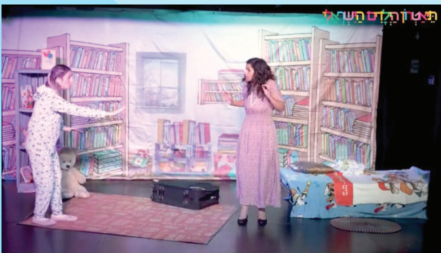
הצגת הילדים "הכובע הקסום שלי" הועברה בזום לחברי בתי הלוחם ברחבי הארץ

◀ כל פעילות התרבות מקוונת, באמצעות תוכנת זום. קבוצות אחיעד לנפגעי הלבם קרב מורשות להמשיך בפעילויות בבתי הלוחם.