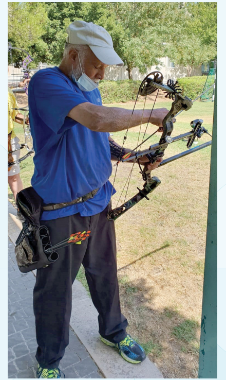
חץ וקשת בבית הלוחם ירושלים

◀ חדר כושר, בריכה, אופני יד ואופני טנדם, פעילות ריצה שיקומית, טניס שולחן, טניס שדה, פטאנק, חץ וקשת, קליעה, בדמינגטון, ביליארד (לנפגעי PTSD).