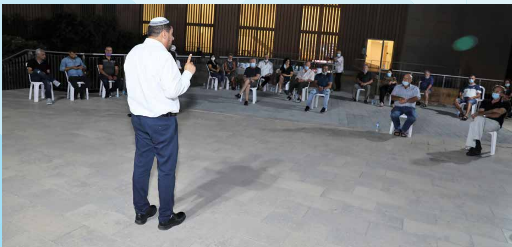
הרמת כוסית לחברי המחוז ברחובות

מזון לכל החברים ב-10 בספטמבר התקיימה ברחובות הרמת כוסית מחוזית לראש השנה, במתכונת מצומצמת ובהתאם לתו הסגול. בחודש האחרון חילק המחוז מתנות לחברי מועדוני השיקום אתגר וחממה ונוסף על כך, לקראת החג חולקו כ-150 חבילות מזון לחברי המחוז הזקוקים לסיוע. אף חבר לא יישאר ללא מזון בחג.