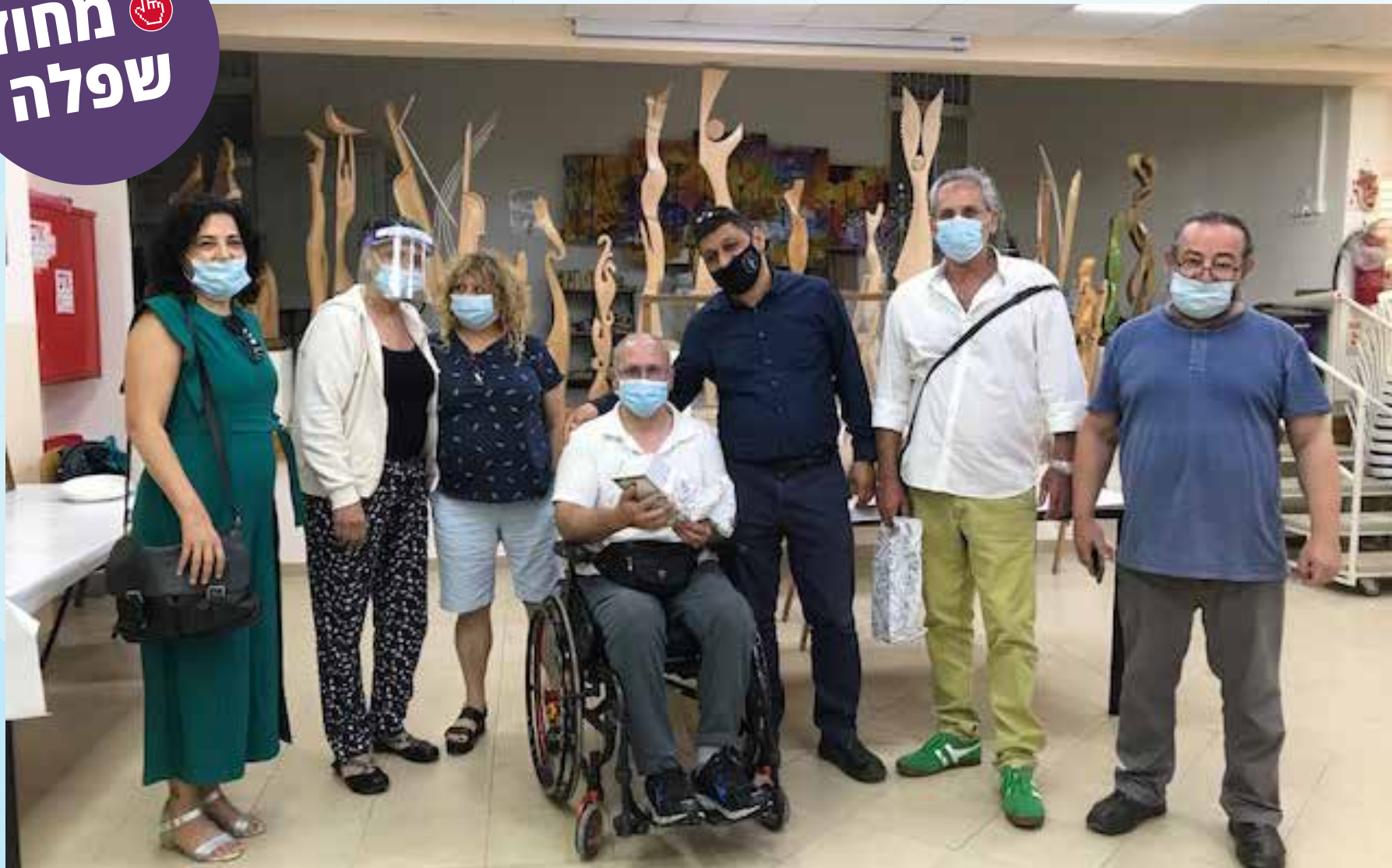
מחלקים מתנות לחברי מועדון אתגר