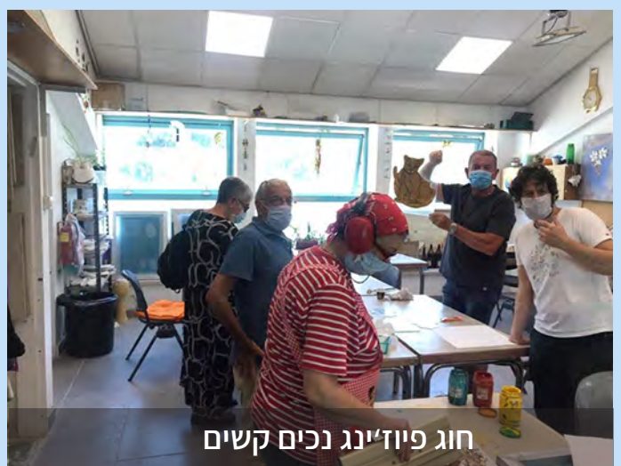
חוג פיוזינג נכים קשים