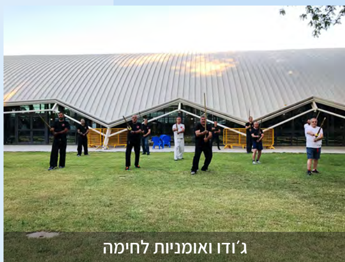
ג'ודו ואומניות לחימה

עדכונים באתר בית הלוחם תל אביב: www.bh-tla.inz.org.il