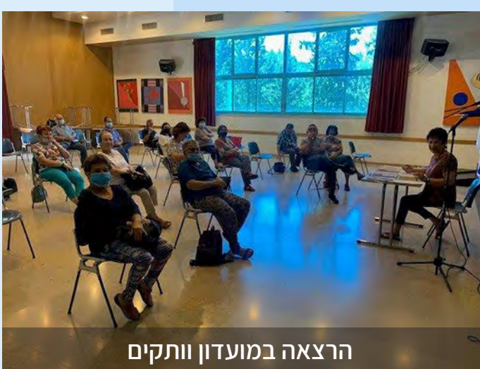
הרצאה במועדון וותקים