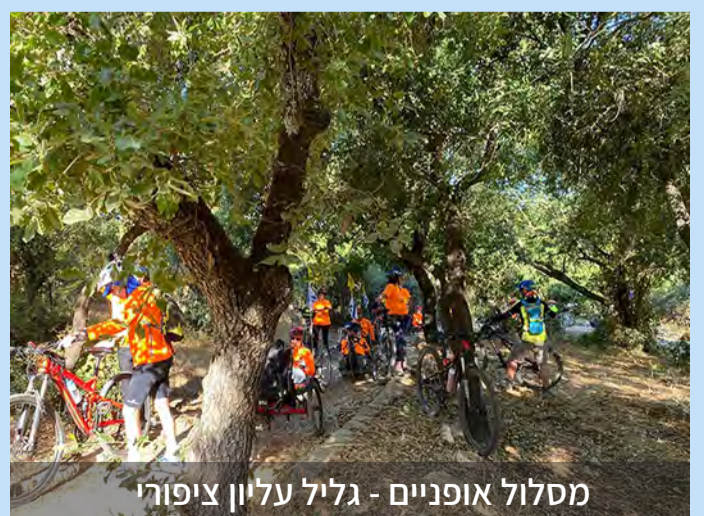
מסלול אופניים - גליל עליון ציפורי