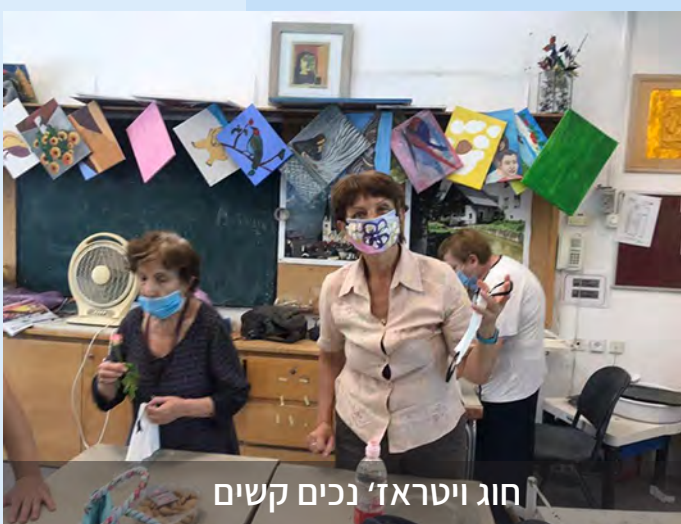
חוג ויטראז' נכים קשים

עדכונים באתר בית הלוחם ירושלים: www.bh-j.inz.org.il