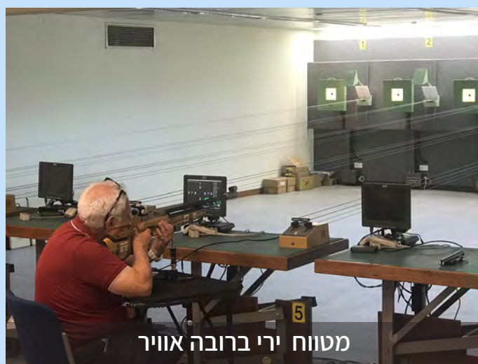
מטווח ירי ברובה אוויר