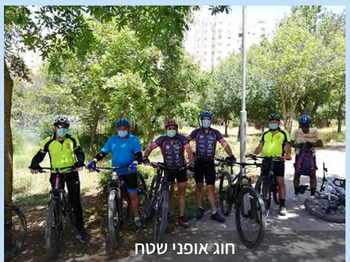
חוג אופני שטח