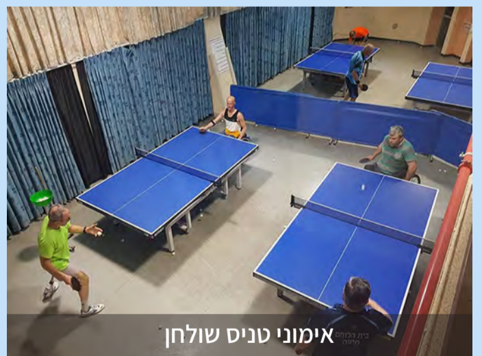
אימוני טניס שולחן