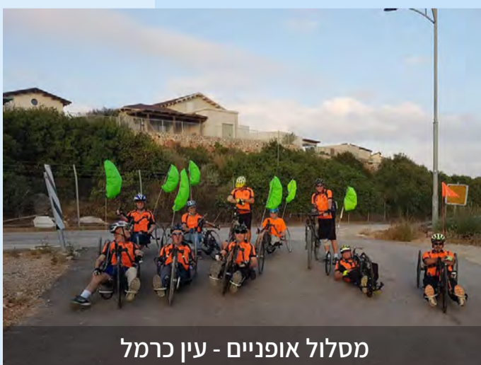
מסלול אופניים - עין כרמל