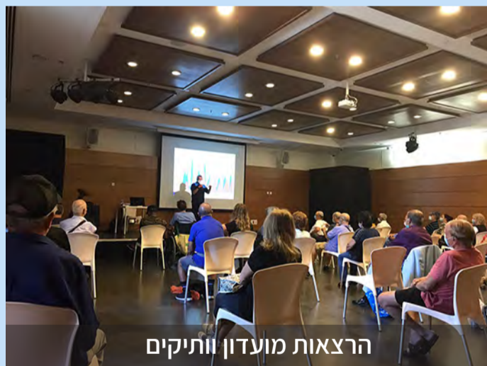
הרצאות מועדון וותיקים