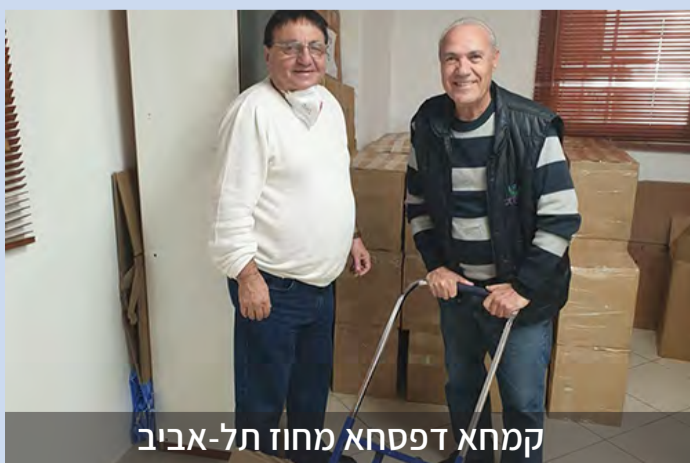
קמחא דפסחא מחוז תל-אביב