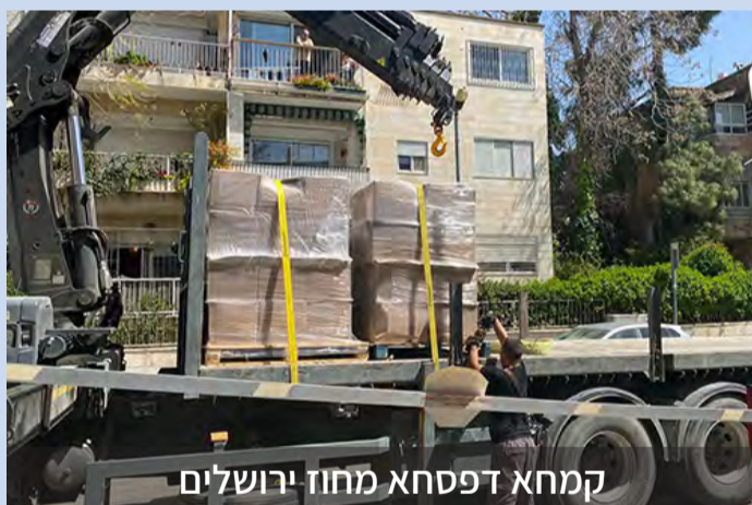
קמחא דפסחא מחוז ירושלים