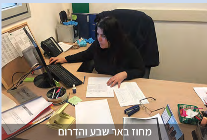
מחוז באר שבע והדרום