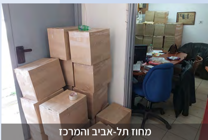
מחוז תל-אביב והמרכז