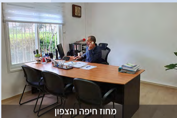
מחוז חיפה והצפון