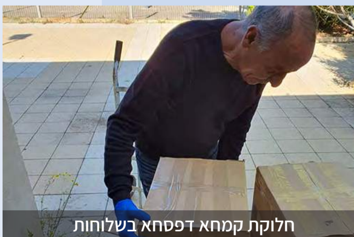
חלוקת קמחא דפסחא בשלוחות