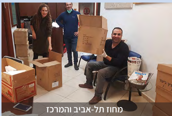
מחוז תל-אביב והמרכז